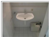
KG Bad / Waschraum