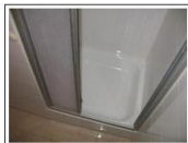
EG Bad mit Dusche