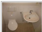
EG Bad Ausstattung